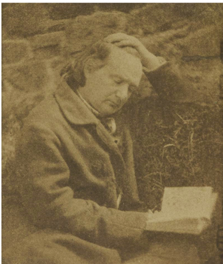
Victor Hugo lisant devant un mur de pierre